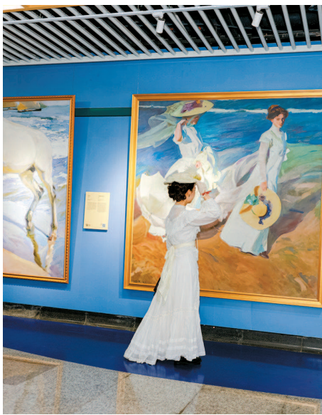
有观众穿着同款服装来打卡

在上海地铁龙华中路站美术新空间, “华金·索罗亚: 西班牙大师的光影漫步”展上, 一幅幅洒满地中海阳光的画作前, 有观众特意穿上与画中人物同时代的服装拍照打卡。 无独有偶, 今年是中法两国建交60周年, 法国著名艺术家法布里斯·伊贝尔为上海地铁特别创作的两件艺术作品《城市·森林》和《友谊》, 也于11月8日在陆家嘴站的换乘通道揭幕。其中长12米的彩绘瓷釉作品《城市·森林》, 将法国山谷间的动人故事娓娓道来。