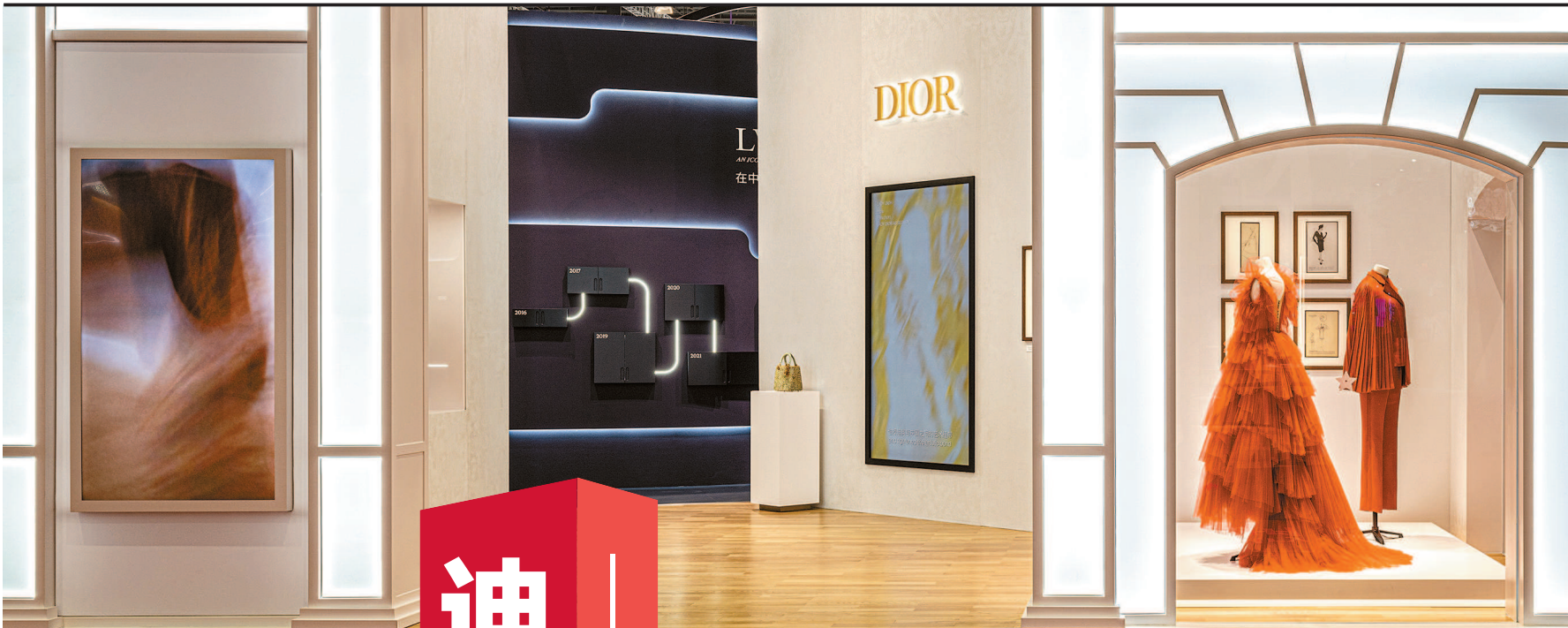
LVMH 路威酩轩集团展馆迪奥品牌展区