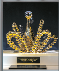
让-米歇尔·奥托涅尔 迪奥真我倾世之金香精 金致玫瑰限量版 2023年