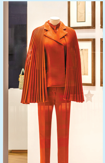
玛丽亚·嘉茜娅·蔻丽 “爱之日”礼服套装 迪奥2018春夏高级订制系列