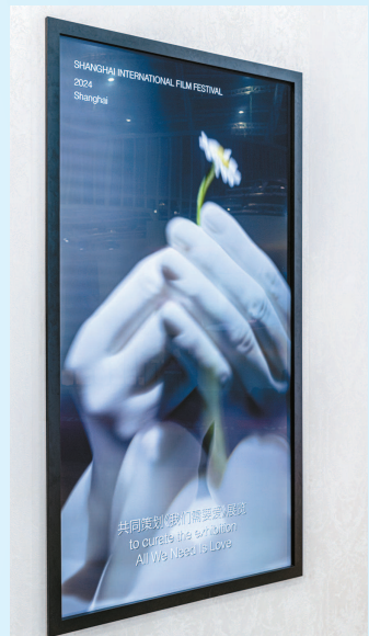
资料片《迪奥与中国》

此外, 迪奥于法国国家馆呈献由中国艺术家刘符洁为“LADY DIOR 我之所见”(LADY DIOR AS SEEN BY) 项目打造的雕塑作品《混生》。多元创意交汇, 铸就非凡杰作, 礼赞迪奥的隽永优雅格调与大胆前卫精神。