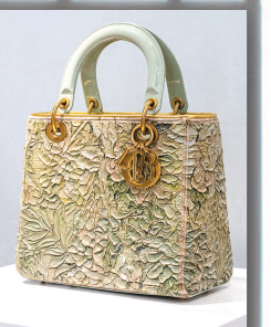
梁远苇 “DIOR LADY ART #9” 艺术家限量合作系列 2024年