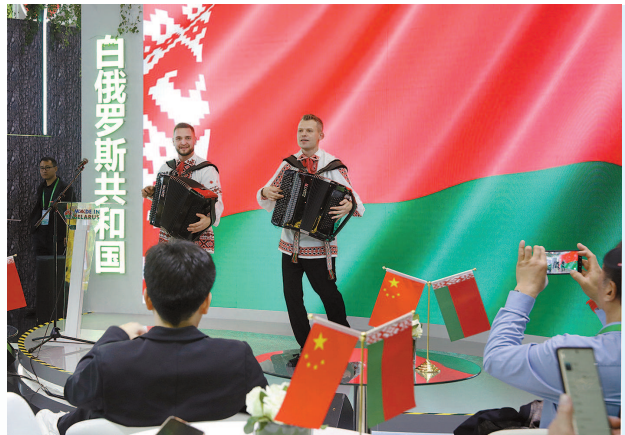
白俄罗斯馆内欢快的手风琴手在表演