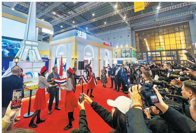
法国馆把“埃菲尔铁塔”搬进展台