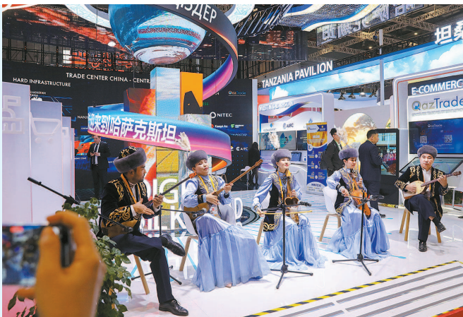
哈萨克斯坦馆内身着民族服饰的乐手在演奏