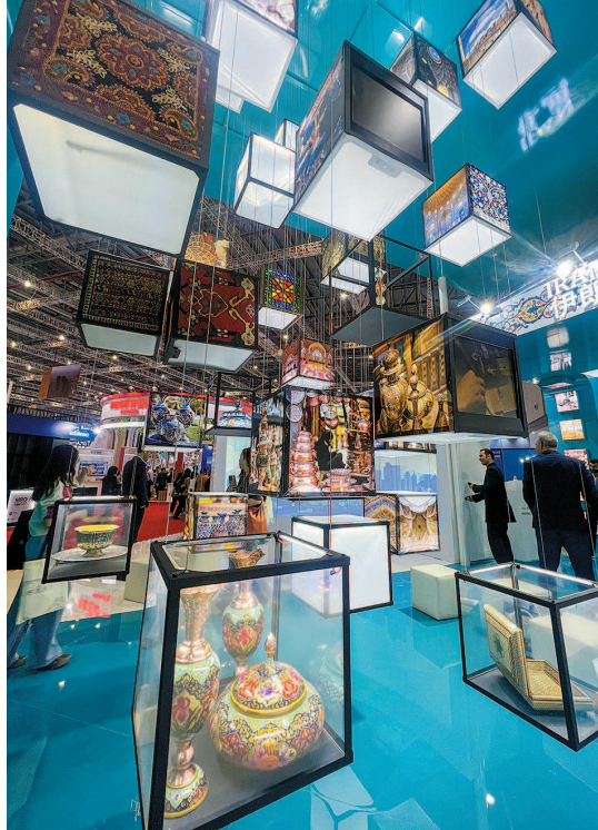
伊朗馆内的精美艺术品