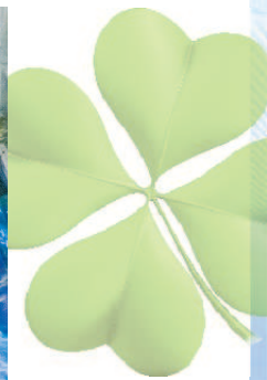
塞尔维亚馆大型多媒体屏幕走廊展示自然元素以及艺术作品