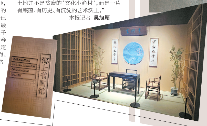
海上书画馆部分展品