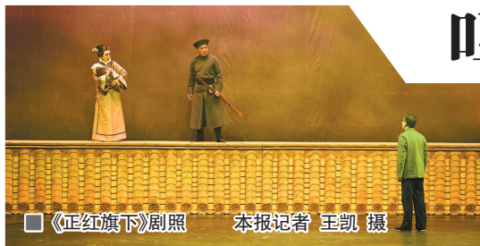
《正红旗下》剧照