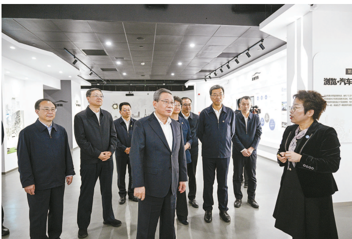
11月3日,中共中央政治局常委、国务院总理李强在上海调研职业教育和技能人才培养工作。这是李强在上海南湖职业技术学院调研。