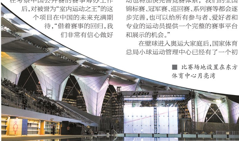
■ 比赛场地设置在东方体育中心月亮湾