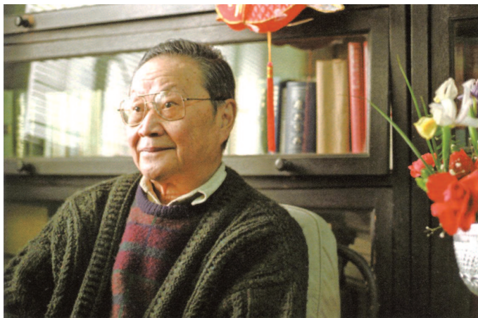
■ 王元化 (文艺理论家)