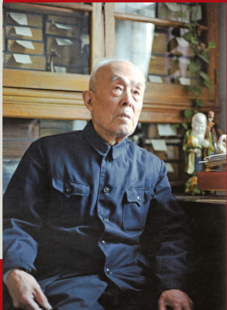
■ 季羨林 (东方文化学家)