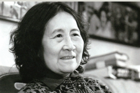
■ 文洁若 (翻译家)