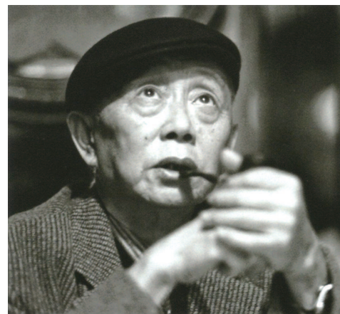
■ 黄永玉 (美术家)