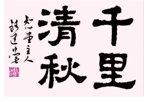
千里清秋 (书法) 钱建忠

最后一百米是当下一个热词。最近有新闻报道,送外卖的快递小哥为了赶时间,为了掐着平台计算规定的点,将电动自行车尽可能地停在最接近取件的地方,这成了快递员的共同行为和不二之选。 问题来了,在快递忙碌的高峰时段,不少地方的人行道被电动车占得水泄不通,人没法走路,快递员自己的座驾经常困在其中而进退两难。于是舆论呼吁要为快递小哥们解决停车的最后一百米问题,在这个问题上,但是这个问题只能这么解决吗?恐怕未必!解决最后一百米的思维,落脚在做好末端管理,问题在于是否所有的末端需求都是合理的?就物流领域而言,点对点是理想目标,快捷是基本要求,但是凡事不能绝对化,在追求理想目标和基本要求时要兼顾所需付出的成本。运输行业最快的是飞机,可是不可能所有物件都走航空,不顾成本地追求极致是不明智的。眼下大家都在说“卷”,这个词非常形象地点出了社会上有恶性竞争、无谓竞争、为竞争而竞争、为表现而表现的不良现象。回到前面的问题,快递小哥送的外卖是否每一件都需要争分夺秒抢时间?下单的客户是否对每一单都要求越快越好地送达?如今好像每件快递都是“急送”,答案应该是否定的。关键问题在于这个规定时间来自平台。对于平台而言,在一定的时间内送出的货越多越好,自己的平台比其他的平台送达的时间越短越好,于是都在时间点上“卷”起来了。平台为了追求利益最大化,快递员也为了多跑单,不惜闯红灯,不顾性命地违反交通规则,为了走近路,快车道、慢车道、人行道都变成了快递车的行车道,这显然不是广大市民愿意看到的。如果因为要满足快递员就近停车的需求,再要不断辟出有限的公共道路资源,又会进一步助长平台抢时间的欲望。不难看出,为了平台的规定时间,为了平台的利益,所付出的社会成本何等之高! 在这个问题上,要看到平台超出合理性的利益背后是付出了大量的社会成本。正确的管理方向不是最后一百米,而是上溯到问题的源头,我们不能让平台出题当主导,从而让政府和社会去解题和应对。有效合理的做法是对平台行为的合理性加强管理和规范,平台在规划快递员送达时间时,要考虑各种意料之外的可能性,要有合适的冗余空间。有关行政管理等部门对平台之间发生的恶性竞争行为,要洞察秋毫,及时发现,并采取相关措施遏制其发生和蔓延。当然,点点的客户也要充分考虑气候、时段等种种不利因素,考虑所送件的紧急程度,对紧迫需要的物件尽早下单,对有特殊原因没有掐点送达的给予一定的宽容,不要动辄投诉。 做好最后一百米的末端管理是十分必要且需要长期坚持的,但是也要因事而异,要讲合理性。