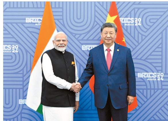
当地时间10月23日, 国家主席习近平在喀山出席金砖国家领导人会晤期间会见印度总理莫迪

新华社俄罗斯喀山10月23日电 (记者赵嫣 安淑萍)当地时间10月23日下午, 国家主席习近平在喀山出席金砖国家领导人会晤期间会见伊朗总统佩泽希齐扬。