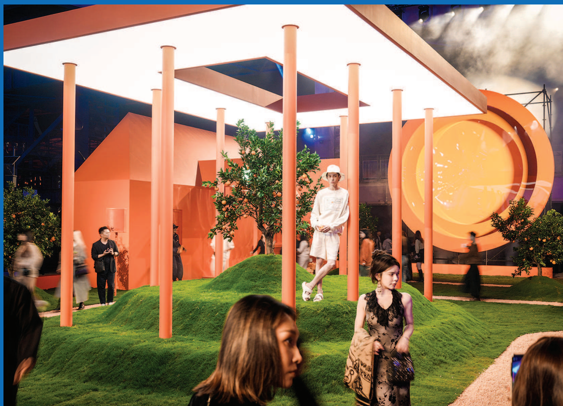
■ 昨晚,盟可睐“天才之城(The City of Genius)”揭开神秘面纱,以五光十色的绚烂沉浸式体验,呈献全球创意先锋新势力

10月19日,一座“天才之城”在黄浦江畔揭开神秘面纱。2025春夏上海时装周的收官大戏——Moncler Genius2024(盟可睐“天才之城”)在30000平方米的空间演绎。它融汇全球视野和中国本土创意文化,成为上海全力打造“全球新品首发地”的又一高能级活动。