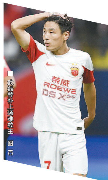
武磊替补上场难救主 图(2)