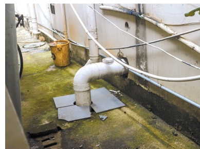
从酒店排出的含粪污水管

粪水漫溢点，就位于这面“界墙”下的非机动车停车棚附近。多位居民情绪激动：他们已经见惯了粪水漫溢而出的污秽景象。一位