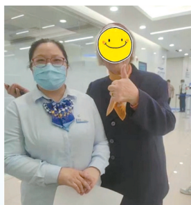
▲ 孔奶奶与建行上海松江新城支行大堂经理合影

为持续改善老年人金融服务体验，松江新城支行为老年客户提供优质金融服务的同时，不断优化营业场所软硬件设