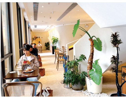
■ 院区咖啡馆为就诊者和家属提供了舒适的休息空间