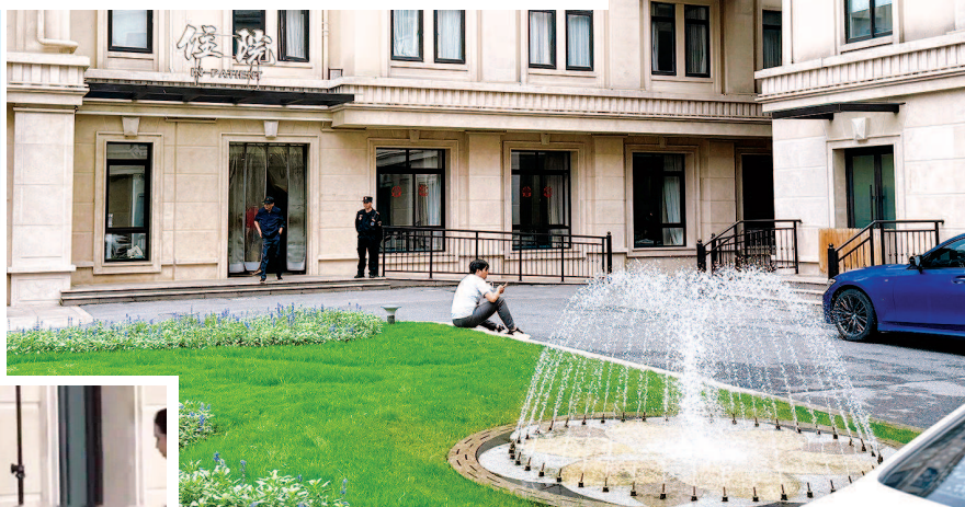
■ 舒适的医院环境提升就诊体验

既然已“见怪不怪”,那为何这波“出圈”却引得议论纷纷?在业内人士看来,医院是有着特殊性质的公共场所,“探店”“打卡”的边界需要厘清。