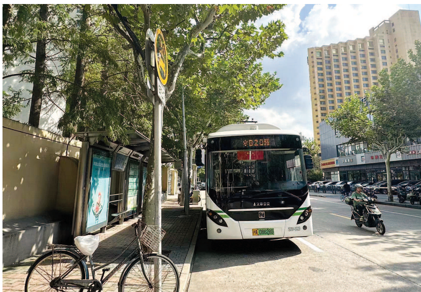
■ 公交820路上行线路始发站靠近市六医院