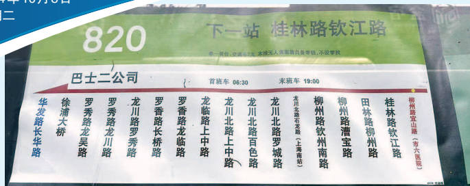
■ 公路820路上行线路有17个站点