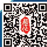
本版编辑/刘珍华 视觉设计/竹建英