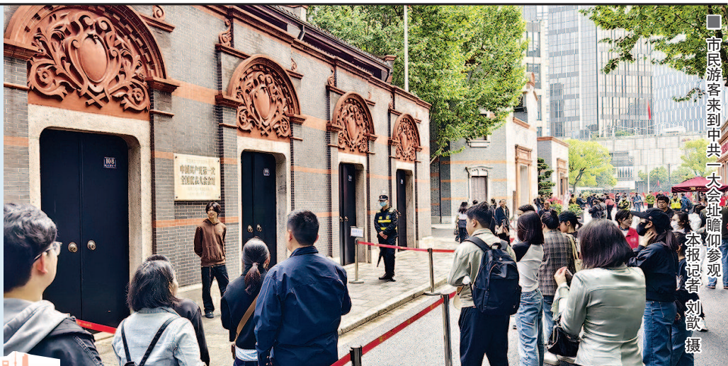
市民游客来到中共一大会议旧址参观。