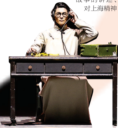
▲ 舞剧《永不消逝的电波》 ▼ 松江泖港镇腰泾村的“望田书屋”

都市繁华很近,“诗和远方”也不远。人们可以躲进博物馆和美术馆,感受历史久远的召唤;也可以在被誉为“林中玉石”的上海图书馆东馆,将“梦境森林”化作阅读景观;还可以在真正的田间地头,以稻香伴书香。青浦区赵巷镇的方夏村农家书屋(稻田图书馆),就位于“一稻”农场内,日常是围绕服务农村社区、满足周边居民阅读需求打造的社区读书社群活动空间,周末则焕新为研学课堂,更多元地向市民游客展现农耕文化。同样在青浦,位于朱家角镇、由林家村