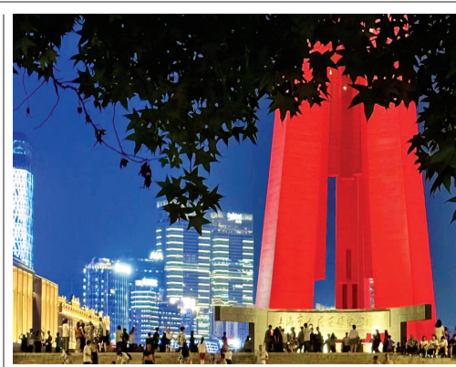
人民英雄纪念碑

在我心里,就渐渐成了一道阴影。这不是我一个人的问题,10个人中9个都是怕牙医的。那时候,到牙防所看蛀牙,进了诊室,耳朵里听到牙科钻头开动时发出的尖锐的“吱吱”声,便浑身酸软。要知道,我小时候踢球时摔上一个大跟头,膝盖见血,站起身来没事人一样,继续踢。这么“凶悍”的娃,到牙防所也瞬间化身小羊羔。 对牙医的敬畏心,一直持续到三十岁。其间,就算牙疼,也不敢轻易见牙医。终于,有一年,智齿发炎,实在扛不住,只好去牙防所。那真是毕生难忘的经历。那位年轻女医生,给我拔牙之前,让我躺平,拿