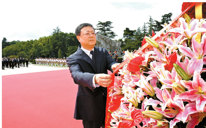
陈吉宁、龚正等市领导和全市各界代表在龙华烈士陵园向人民英雄敬献花篮

“礼兵就位!”随着号令,礼兵步伐铿锵,正步行进至纪念碑前伫立。伴随着雄壮的《义勇军进行曲》旋律,全场齐声高唱中华人民共和国国歌。国歌唱毕,全场肃立,向为中国人民解放事业和共和