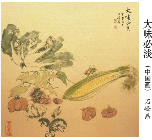
大味必淡 (中国画) 石峰昂