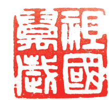
祖国万岁 (篆刻) 孙浩