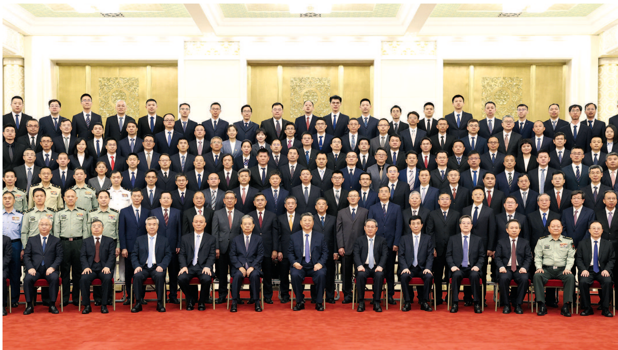
9月23日,党和国家领导人习近平、李强、赵乐际、王沪宁、蔡奇、丁薛祥、李希等在人民大会堂会见探月工程嫦娥六号任务参研参试人员代表并参观月球样品和探月工程成果展览。这是习近平等会见探月工程嫦娥六号任务参研参试人员代表