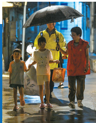
► 昨晚，金山区山阳镇山新居委会工作人员护送山阳老街上的孩子前往安置点