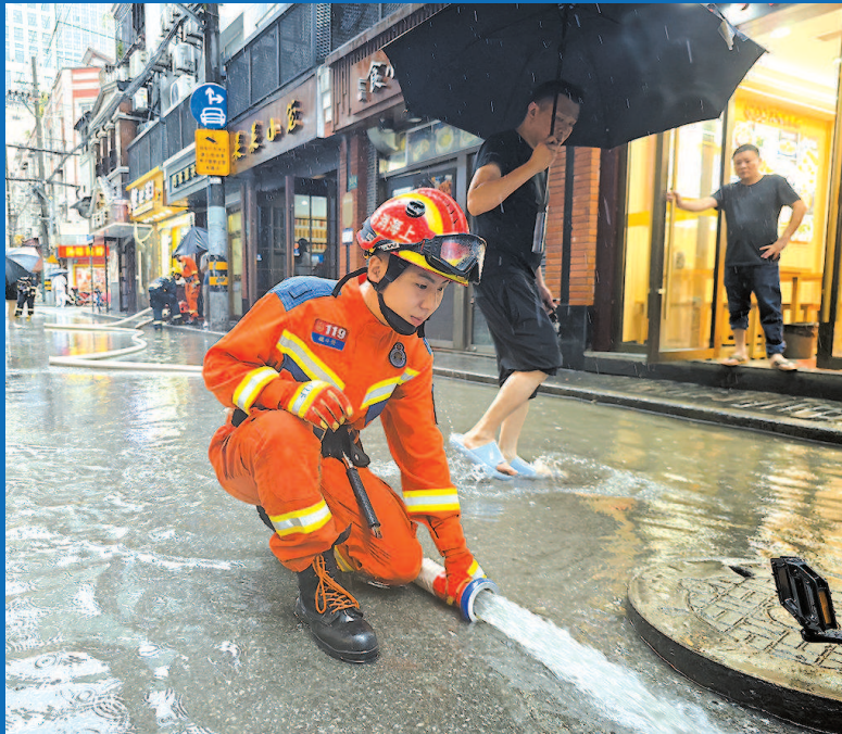
▲ 今天上午，消防人员在黄浦区天津路抢排积水