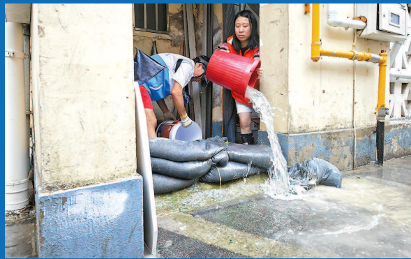
▼ 今天上午，金山区石化街道四村居民区76号至86号等区域积水严重，居委会、物业、业委会第一时间帮助底楼居民排水。上午10时，积水已基本排除