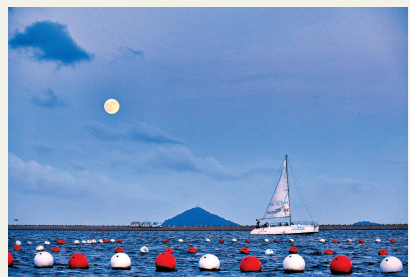
中秋,明亮硕大的“超级月亮”给金山城市沙滩增添了浪漫色彩