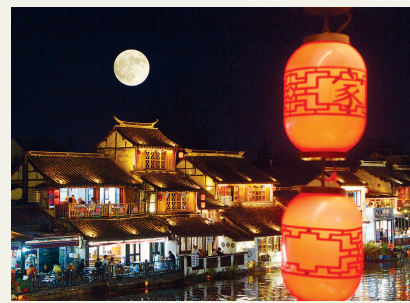
夜幕下,一轮明月与水乡古镇朱家角的特色民居和红灯笼融为一体,勾勒出一幅唯美的中秋月圆图