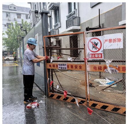
■ 工人将被风吹断的改造工地上的警戒线重新拉起