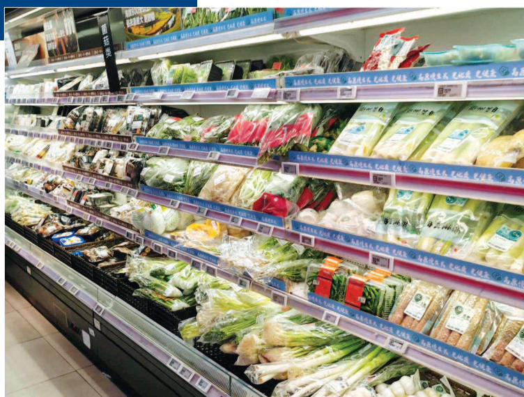
■ 盒马线下门店正常营业,货架上菜品满满

同时,上海蔬菜集团还将密切关注来沪主要高速和物流交通情况,做好市场农产品的价格监测,重点关注毛豆、芋艿等时令蔬菜的供应和销售情况,并根据市场所需加强与基地的联系,做好产区的增加和调整准备,持续发挥“大市场、大平台、大流通”优势,确保“路上有菜、市场有菜”。