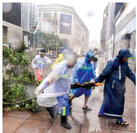
■ 南京路步行街风雨大作,环卫工人正清理被吹倒的树木