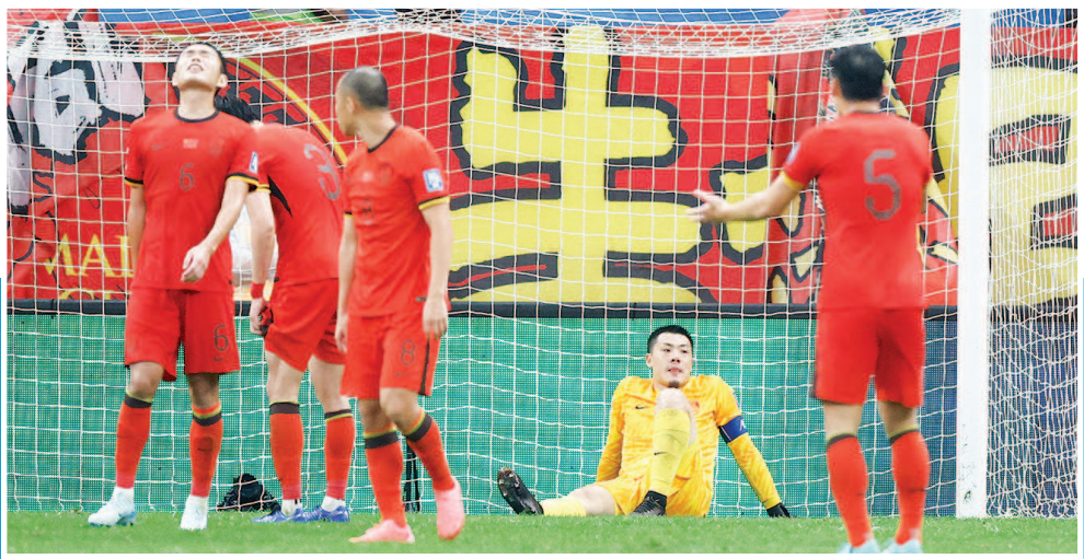
中国队补时阶段遭绝杀

接下来还有8轮,变数依然很多。中国队可以不出线,但至少不要成为早早就被淘汰的那支球队。认清实力而又不放弃,力拼每一个对手,才对得起球迷。