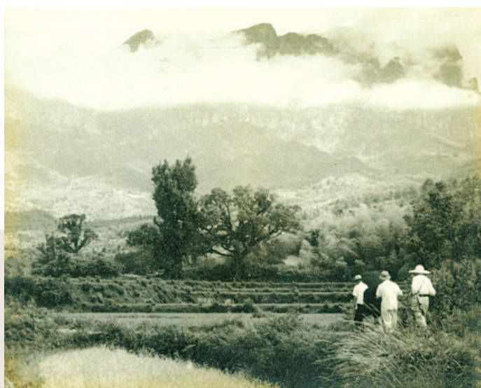
▲ 赵超构在照片背后 题“49年在昆明池为叶 圣陶、刘尊棋摄的背影”

东伴伴我作山行 白云山头云欲立 作者 赵超构 双镜头反光镜箱(禄莱可得) 摄于庐山五老峰下 上午十一时 F11 百分之一秒 加淡黄镜头