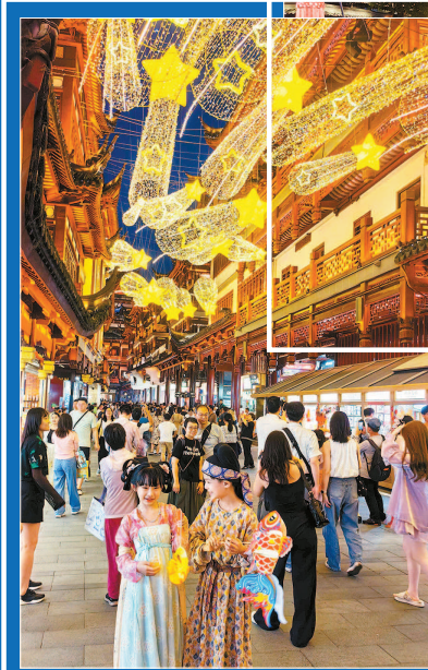
灯饰“流星拂晓空”点缀豫园，吸引游客留影