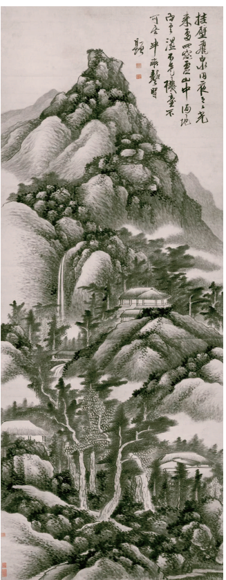
■ 清代画家龚贤的《挂壁飞泉图》

浓荫匝地,凉意自生,古人喜欢在居住的房舍前后多植树木,以树荫营造出消暑纳凉的闲适环境。我国清初画坛“六大家”之一的王翬画了一幅《山水图册》,画面上茂树修竹,溪水缓流,浓荫下的草堂轩窗敞开,屋中主人静心读书,室外有骑驴客人缓缓来访。作者以明代画家沈周的一首诗作为题画诗:“山崖茅檐树压溪,摊书不觉日痕西。庭前红