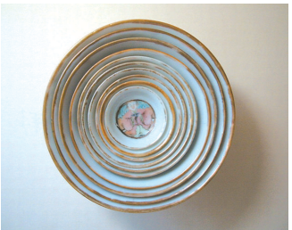
■ 由10个粉彩马蹄杯组成的套杯

壁与足底施豆瓣绿釉。最大杯底有“大清嘉庆年制”六字三行篆书款。十个杯子上分别绘有《佛殿奇逢》《妆台窥简》《僧房假寓》《斋坛闹会》《长亭送别》《锦字传情》《夫人停婚》《衣锦还乡》《乘夜逾墙》《白马解围》