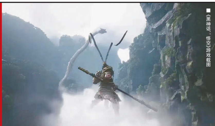
《黑神话：悟空》游戏截图

1961年，上海美术电影制片厂出品中国首部水墨动画《小蝌蚪找妈妈》，形象取材自齐白石先生创作的鱼虾等，青蛙、鱼虾从宣纸游进了银幕，好评如