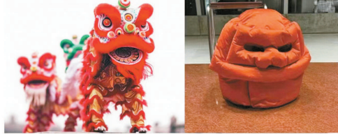
■ 醒狮文化和醒狮头盔包