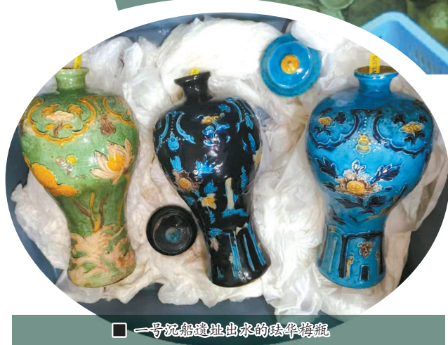
■ 一号沉船遗址出水的珐华梅瓶

一号沉船船货以外销瓷器为主,二号沉船船货以从海外输入的木材为主,共同再现了海上丝绸之路的贸易繁盛景象。两艘沉船相距仅十多海里,是我国首次在同一海域发