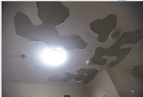
居民楼内顶部粉刷面大量脱落