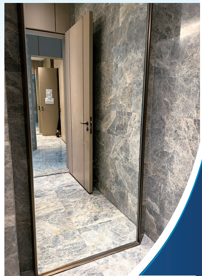
镜子安装在男洗手间的墙壁上

根据《中华人民共和国民法典》相关规定，酒店作为经营者，对消费者具有法定的安全保障义务。经营者、管理者的安全保障义务是指对他人人身财产安全的合理提醒和保护义务，该责任限于场所存在安全设施、安全管理等方面的缺陷、隐患致使进入该场地的人员陷入违背其主观意愿的危险状态而遭受损害。而在陈女士看来，假期中许多家庭带着孩子来游玩，亲子酒店作为提供服务的场所，有责任从孩子角度排查酒店内可能存在的安全隐患，并提供符合儿童安全标准的环境或设施，对潜在风险应设置必要的警示标识，避免孩子可能遭遇的伤害。 本报记者 王军