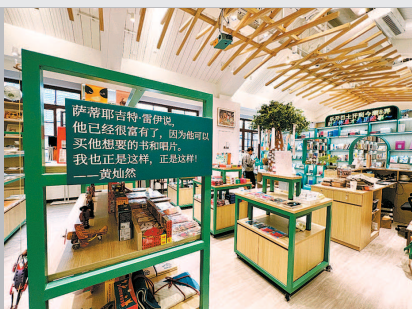
▲ 乐开书店·今潮8弄店