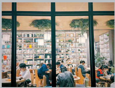
▲ 位于和平公园的和平书院