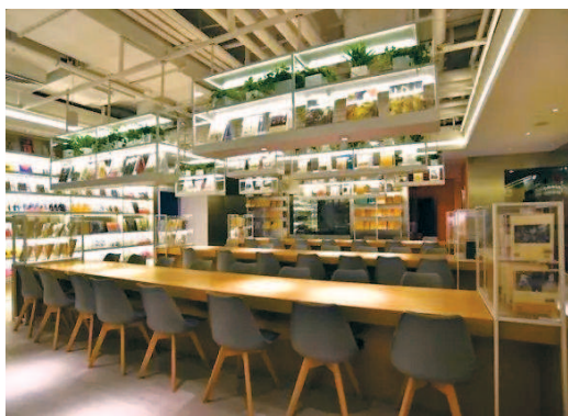
▲ 大隐书局“深夜书房”