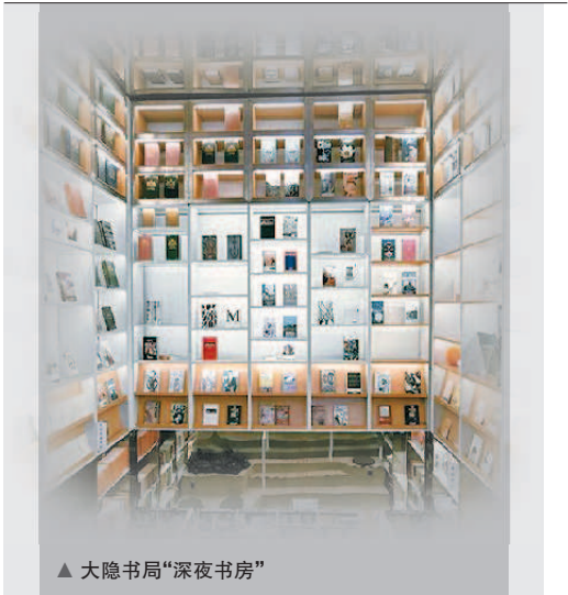
▲ 大隐书局“深夜书房”