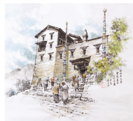
长征卓克基会议旧址 (彩墨) 荣德芳

过去,“象宫”里为防止意外发生,有的地方用钢筋水泥建有仅容一人侧身通过的围墙门。两个场地间隔断门是用能水平移动的钢管构建的,有时“八莫”稍一用力,直径8厘米的钢管就会弯曲变形。每次看它,喂它食物,别太靠近!“好了,别太靠近!”饲养员按规定与象严