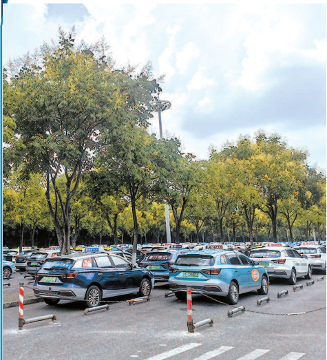
蓄车场内停满出租车