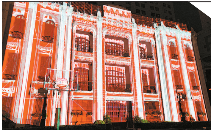
■ 光明中学主教学楼上周第一次完成灯光调试,在夜色中被点亮