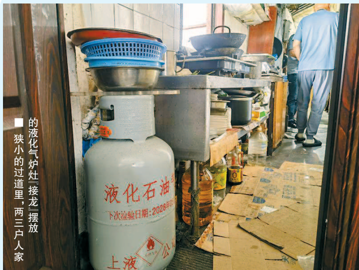
■ 狭小的过道里,两三户人家的液化气炉灶“接龙”摆放

瓶装液化石油气停送! 断炊, 停浴……家住浦东新区上南路3288号的多位居民近日向“新民帮依忙”求助, 炎炎夏日, 他们这幢楼10户人家突然发现: 使用了三四十年的液化气, 已经被停止配送供应。“燃气公司怎能说断供就断供, 没有通知, 没有‘替代方案’, 这让阿拉怎么办?” 而燃气公司给出的说法是: 出于燃气安全考虑。