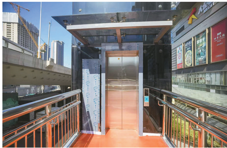
▲ 西藏北路海宁路口天桥新建电梯未启用 ▶ 西藏北路海宁路口天桥的人行楼梯

市民陈先生向本报夏令热线反映，早在今年2月，位于西藏北路海宁路口天桥加装了3部无障碍电梯，至今仍未启用，沦为“摆设”。烈日暴晒之下，市民们想要过街，只能无奈地爬40多级台阶。