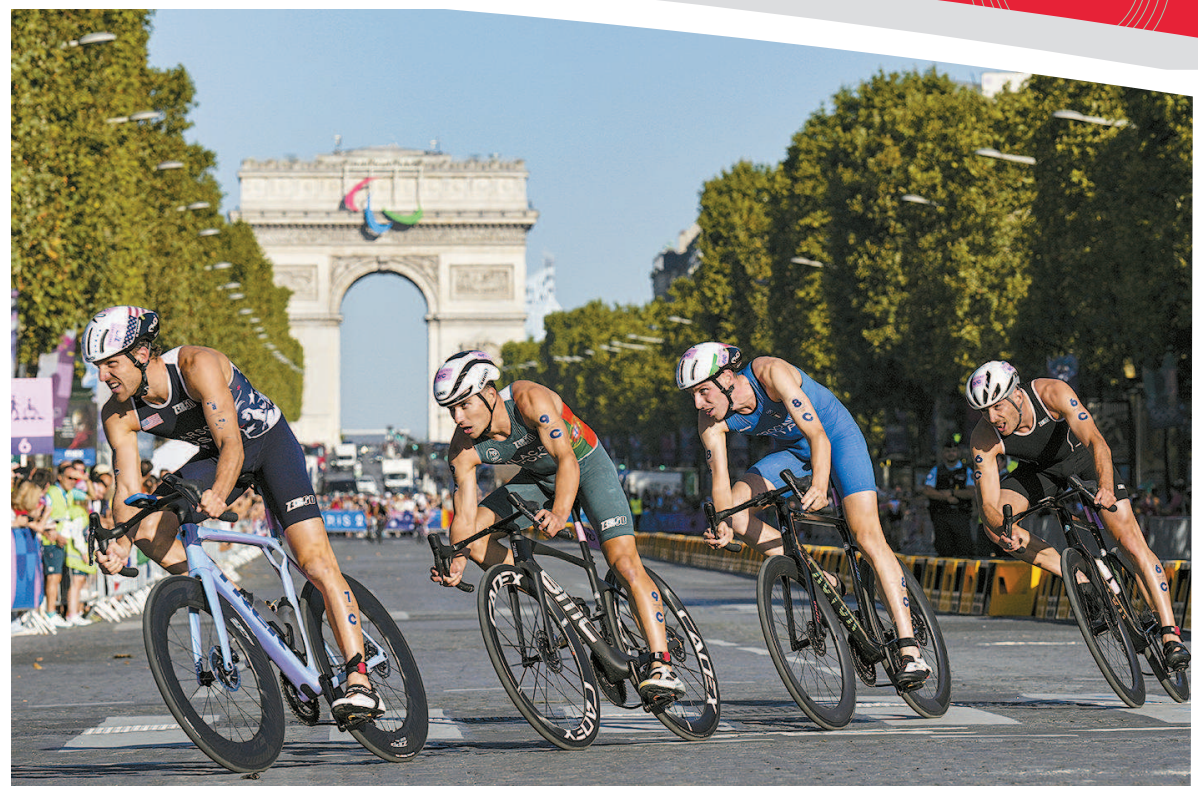
>> 骑行凯旋门 8月5日,铁人三项接力赛中,选手们骑行通过凯旋门赛段