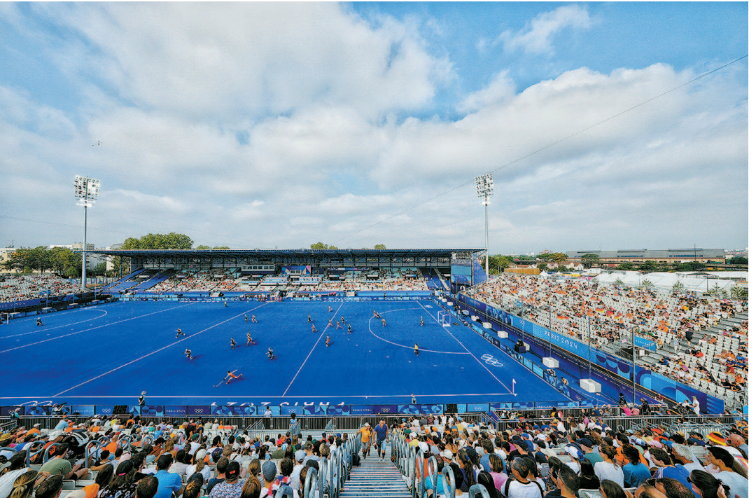
>> 赛回百年前 8月2日,在100年前的奥运会开幕式场地伊芙庄园球场内,女子曲棍球循环赛中国队正在对阵德国队

们坐在凡尔赛宫花园内欣赏马术越野赛时,仿佛进入了修拉的画作之中,优雅的马术与凡尔赛宫的磅礴大气浑然一体,美不胜收。 百年奥运之城是独属于巴黎的荣耀,当运动的激情与流动的盛宴相遇,巴黎独有的魅力中又增添了一份活力。塞纳河两岸,无数运动员在各地地标留下的奥林匹克精神,将从这座城市传递到全世界。 (本报巴黎今日电)