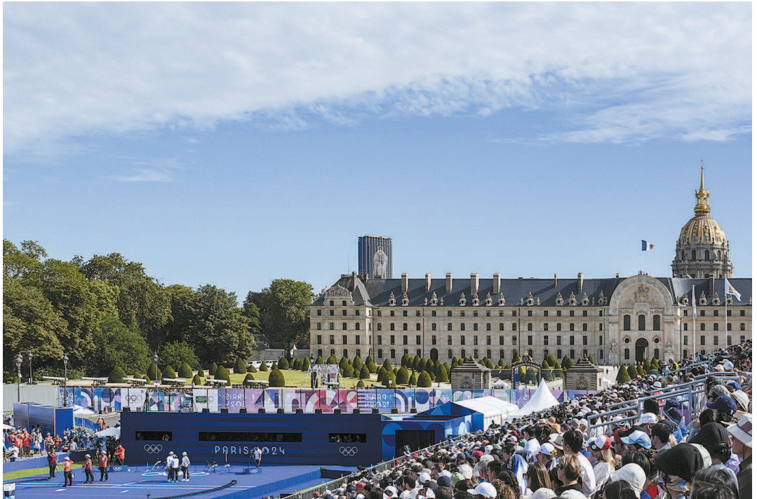
>> 箭“射”荣军院 7月28日,女子射箭团体决赛在荣军院内举行,最终韩国队力克中国队获得金牌