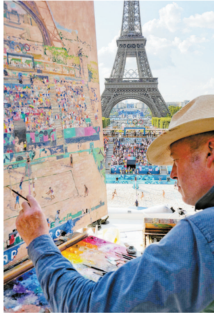
>> 融合巴黎美 8月2日,一位画家正在埃菲尔铁塔下的沙排球赛场观赛作画