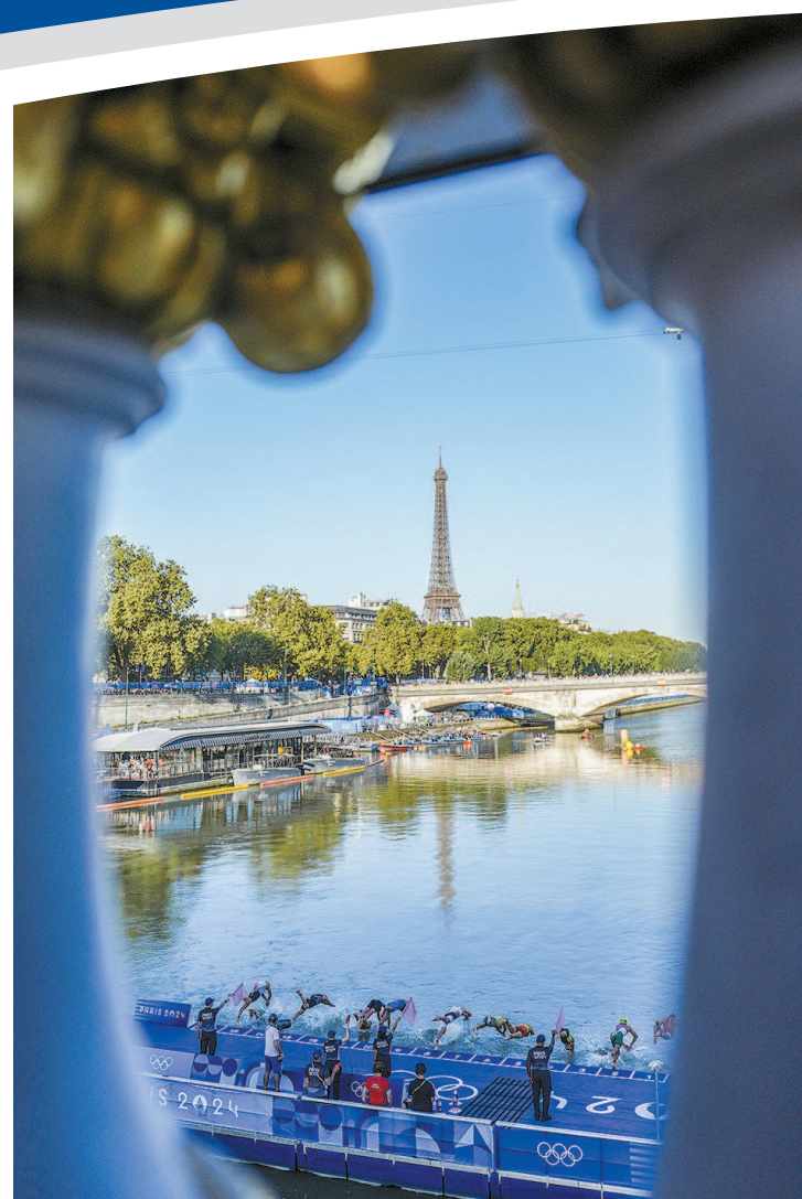
>> 跃入塞纳河 8月5日,铁人三项接力赛中,选手们跃入塞纳河中比赛