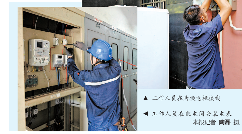
▲ 工作人员在为换电柜接线 ▲ 工作人员在配电间安装电表

施工两小时左右后，充换电柜就完成安装并接好了电。“没想到你们一下来了这么多专业的师傅，这么快