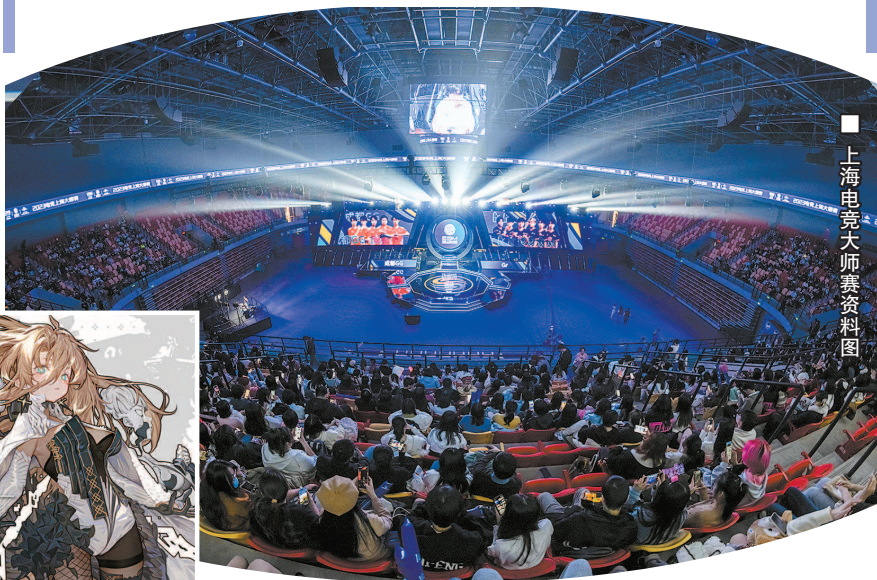
■ 上海电竞大师赛资料图