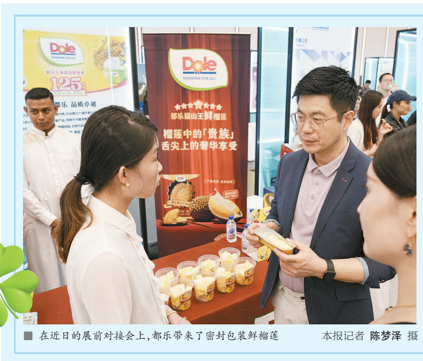
■ 在近日的展前对接会上,都乐带来了密封包装鲜榴莲