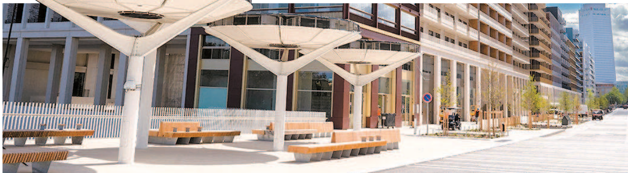
奥运村人行道上的空气净化装置