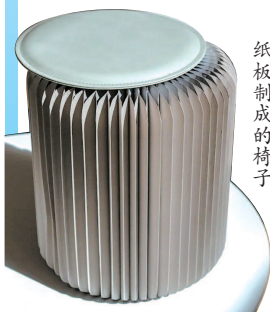
房间内用可回收纸板制成的椅子

奥运会期间,巴黎奥运村将接待超过14000余名运动员和工作人员。为了方便运动员前往赛场,奥运村建在巴黎北部的塞纳河畔,横跨圣德尼、圣旺和利勒圣德尼三个地区。人数庞大的奥运村总共提供了14250张床位,分布在3000套公寓内。值得一提的是,这些床均由可回收材料制成。一张长2米、宽0.9米的纸板床,承重达到250公斤。奥运村的工作人员做过测试,