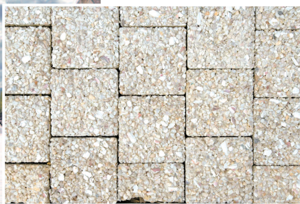
奥运村人行道地砖加入贝壳等材料,吸水、降温性能更好