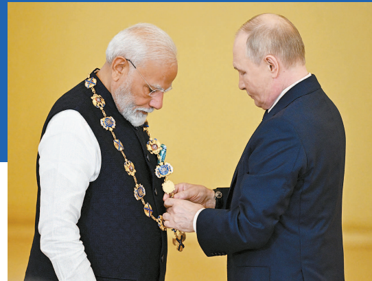
▲ 普京向莫迪颁授圣安德烈勋章 ▲ 普京(中右)与莫迪(中左)举行会谈