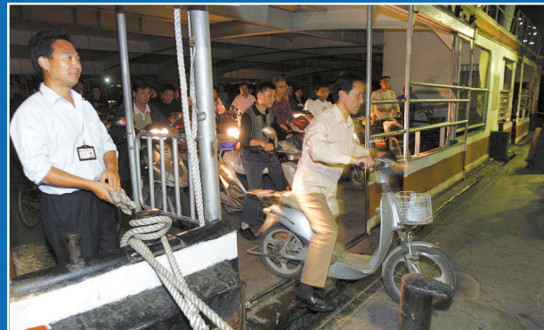
▲ 2006年10月15日凌晨,最后一班轮渡抵达浦东周家渡码头,根据上海世博园区规划,周家渡码头当天起停运拆迁