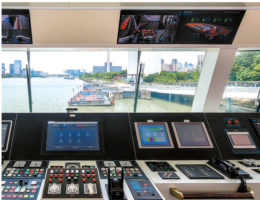
“上海轮渡11”驾驶舱内先进的操作系统