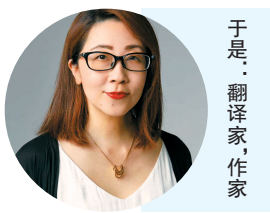
于是: 翻译家, 作家