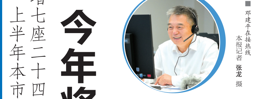
邓建平在接听热线

今年上午，上海市绿化市容局党组书记、局长邓建平走进新民晚报夏令热线，接听市民来电并接受采访。邓建平表示，今年将推动单位附属绿地开放40个，完成1200座环卫公厕适老化适幼化改造，2024年至2026年将再建设300个“美丽街区”。此外，还将不断优化生活垃圾全程分类体系，推动垃圾分类提质增效。