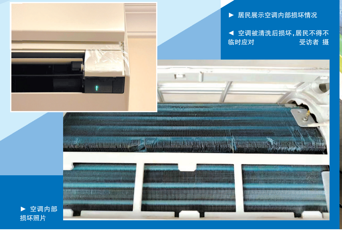
空调内部损坏照片

酷暑来袭，申城最高气温一度超越35℃，空调成了大家的必需品。在经过大半年的“休息”后，不少人希望给空调来个“大清洗”。然而，若在此时空调却因清洗不当而损坏，无疑会让人倍感焦急与无奈。近日，新民晚报夏令热线收到了不少居民的投诉，讲述在空调清洗服务过程中，遇到了清洗后损坏等各类消费服务纠纷，影响到居民的正常生活，让人十分恼火。