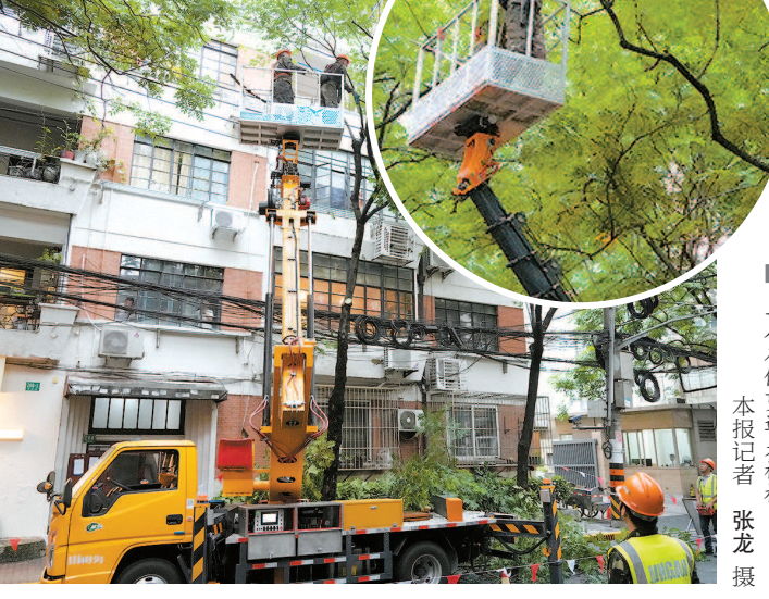
工人在修剪遮光树枝

“大树生长比较迅速，为保证十月观花观果的效果，一般不会像悬铃木那样进行大规模回缩修剪。但若