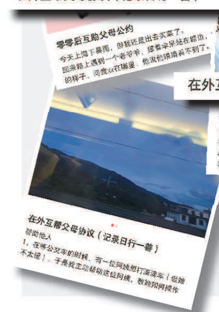
零零后互助父母公约