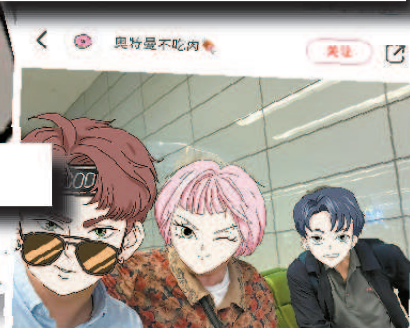
在外互助父母协议，我签了，你接嘛