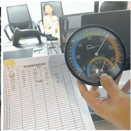
▲ 温度记录表上的数字，和在此运动的市民体感有较大差异