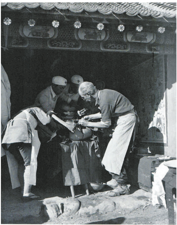
■白求恩大夫 (摄于一九三九年)