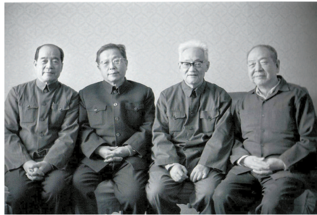
■文学大师孔罗荪、曹禺、巴金、欧阳山 (摄于1981年)