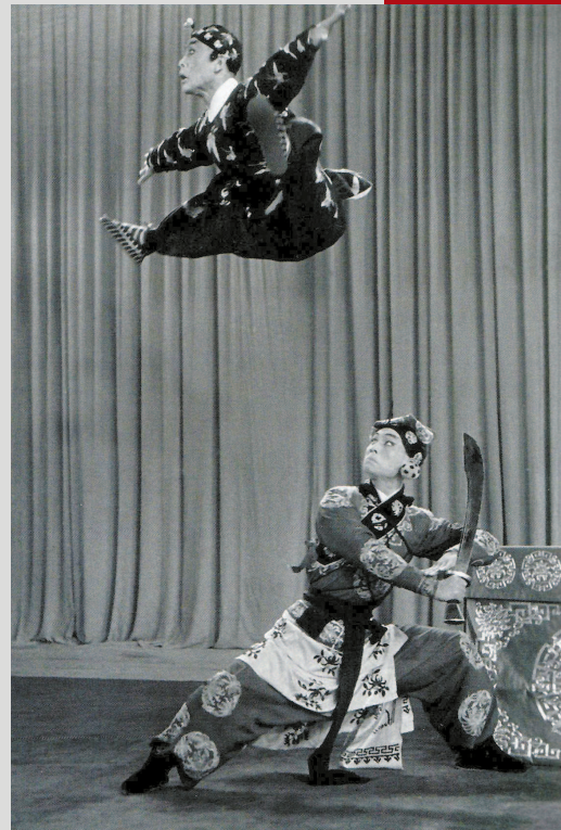
■京剧《三岔口》剧照 (摄于1951年)