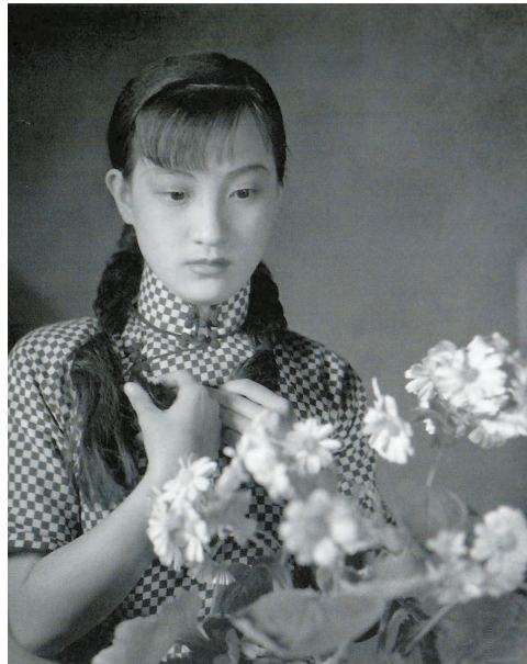
■周璇 (摄于一九三六年至一九三七年)