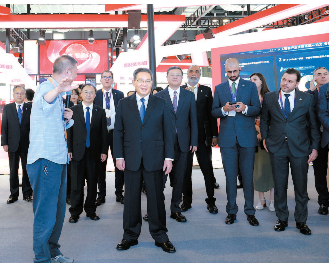
■ 二〇二四世界人工智能大会暨人工智能全球治理高级别会议开幕式后,李强同与会外方嘉宾、国际组织代表共同巡馆

李强指出,中国始终积极拥抱智能变革,大力推进人工智能创新发展,高度重视人工智能安全治理,实施了一系列务实举措,发布了《全球人工智能治理倡议》,向第78届联合国大会提出了加强人工智能能力建设国际合作决议并获得一致通过,为全球人工智能发展和治理作出积极探索,贡献了建设性思路和方案。(下转第3版)